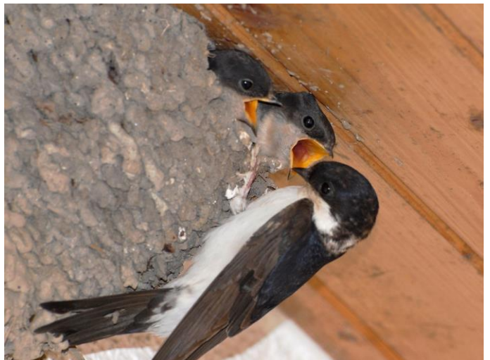
Mehlschwalbe am Füttern

Um die bestehende kleine Mehlschwalbenkolonie an der Vogelsangstrasse zu erhalten und evtl. zu vergrössern, haben wir in der Dorfzeitschrift «Oetwiler» im Rahmen eines Artikels über Mehlschwalben einen Aufruf gestartet, um bei privaten Hausbesitzern weitere Nisthilfen aufhängen zu können. Bereits dieses Jahr konnten bei zwei Hausbesitzern einige Nisthilfen abgeben, die mit unserer Beratung fachgerecht montiert wurden. Bei einem weiteren Interessenten steht die Montage noch bevor.