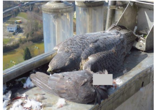
Vergifteter Wanderfalke und Ködertaube

Zwischenzeitlich konnte Martin Sinniger einen Taubenzüchter überführen, welcher mit einer solchen Kamikaze-Taube einen Junghabicht vergiftet hatte. In einem weiteren Fall wurde ein Taubenzüchter verhaftet, bei welchem er eine nach gleichem modus operandi präparierte Taube abfangen konnte, noch bevor diese von einem Beutegreifer geschlagen wurde. Die Taubenzüchter wurden mit bedingten Gefängnisstrafen von mehreren Monaten und mit Bussen bestraft. (Vortrag und Bericht Martin Sinniger)