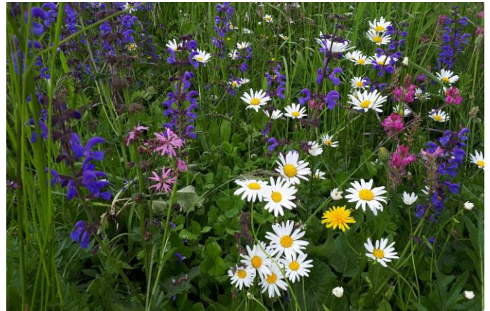
Farbige Blumenpracht in der Pfruenderhaab

Die Landschaft am See in der Pfruenderhaab ist ein summendes und surrendes Blütenmeer. Aus 25 Bewerbern wurde die Männedorfer Wiese aufgrund der Artenvielfalt als Gewinnerin auserkoren. Die angrenzende NVMU-Jubiläums-Hecke mit Krautsaum erhöht den ökologischen Wert des Areals zusätzlich. (Amadeus Morell)