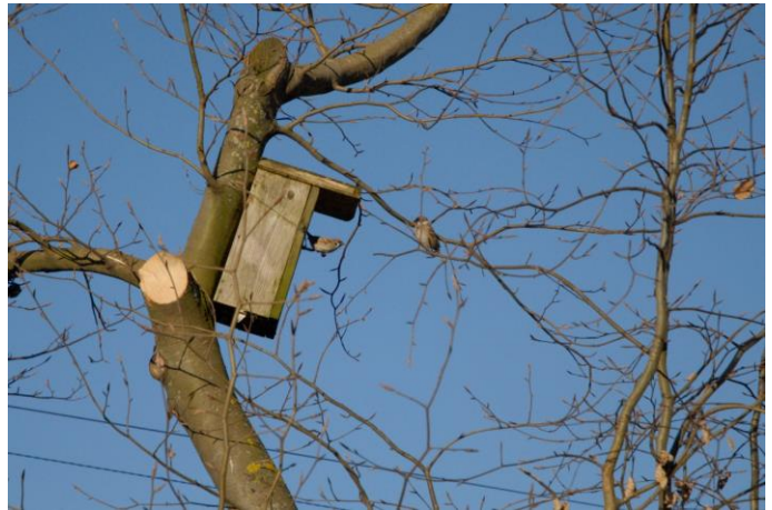
Feldsperlinge am Nistkasten

Bezüglich der bestehenden Nistkästen erwies sich das letzte Jahr wieder als normales Jahr. Sie waren in ähnlichem Rahmen belegt wie in den Jahren zuvor. Hauptsächlich profitierten Kohlmeisen, Blaumeisen, Kleiber und Feldsperlinge von unserem Nistangebot.