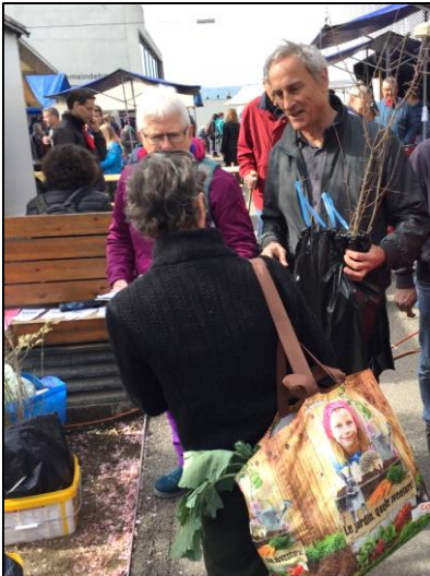
Gratissträucher vom NVMU/NNP

Am Leuenmärt verschenkte der NVMU wiederum ca. 50 einheimische Sträucher an Männedörfler, die in ihrem Garten etwas für die Biodiversität tun möchten. Wer keinen Platz für Sträucher hat, fand für die Terrasse sicher eine geeignete Wildstaude.