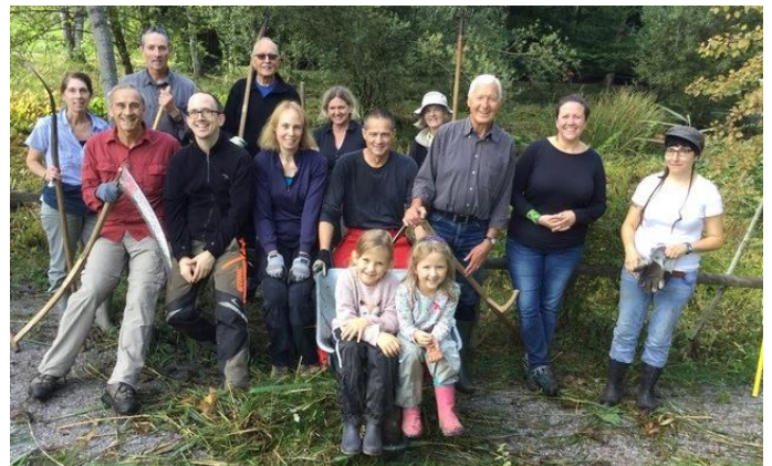
Die Schilfschnitter vom Bolligerweiher

Mitglieder des NVMU aus Männedorf, Uetikon, Oetwil und Stäfa, sowie interessierte (noch) Nichtmitglieder, insgesamt 15 Personen (darunter zwei Kinder), haben am letzten Samstag im September bei angenehmem Herbstwetter mit Maschinen und Sensen das Ried am Bolliger Weiher gemäht, das Schnittgut von Hand mit Rechen und Gabeln aus dem sumpfigen Untergrund herausgebracht und auf einen grossen Haufen am Waldrand geschichtet. Dieser – wie auch ein neu angelegter Asthaufen – werden so bald Insekten, Amphibien, Reptilien und Kleinsäugern ein sicheres, frostfreies Winterquartier bieten.