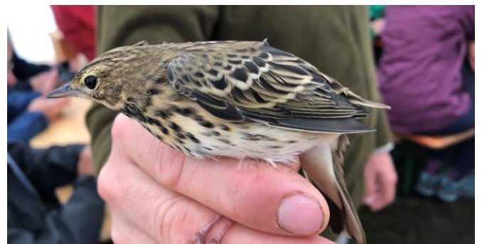
Beringung eines Baumpeipers