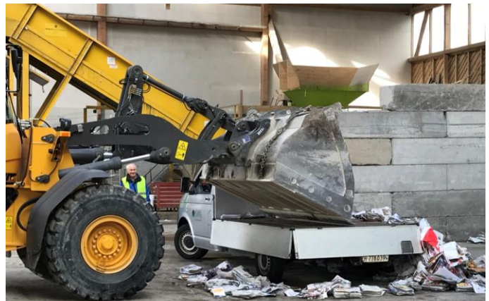
Papier abladen mit dem Trax