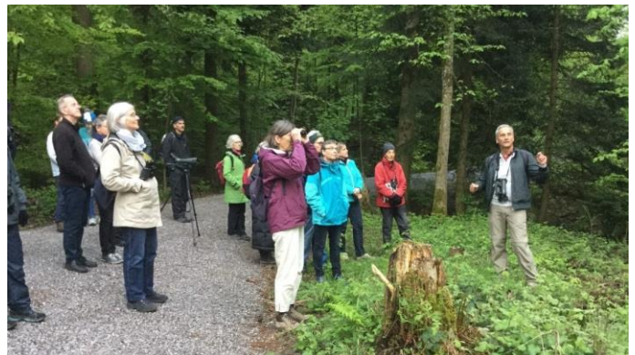
‘Zi willy willy zi zi spenzia’ muss gelernt werden

Zum Schluss genossen wir Kaffee, Gipfeli und Kuchen im Anna-Zemp Garten. Vielen Dank an Veronika! (Amadeus Morell)