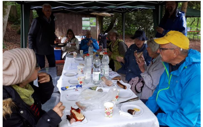
Gemütliches Zusammensein unter dem Zeltdach

Am Samstag, 25. Mai 2019 haben wir zum zweiten Mal zum «Festival der Natur» am Bolliger Weiher eingeladen. Das Festival der Natur fand schweizweit schon zum vierten Mal zum internationalen Tag der Biodiversität statt und bot zahlreichen Menschen vielerlei Möglichkeiten, die Schönheiten der Natur zu zeigen und auf die Bedeutung und Gefährdung der biologischen Vielfalt aufmerksam zu machen.