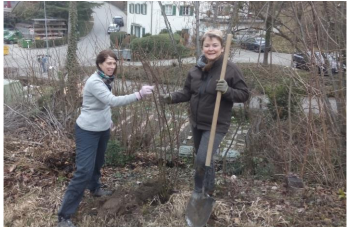
Pflanzung von Blütensträuchern im Chiletöbeli