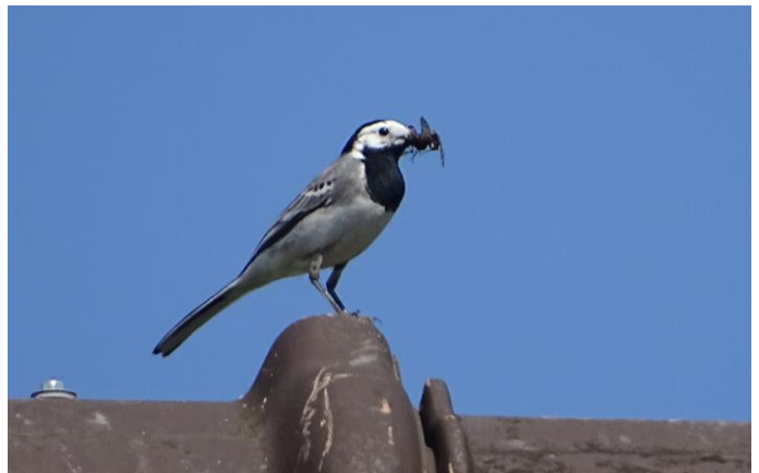
Bachstelze bringt Futter

Am Schluss jeder Führung genossen wir die herrliche Aussicht von der öffentlich zugänglichen Terrasse des Naturgartenzentrums. (Amadeus Morell)