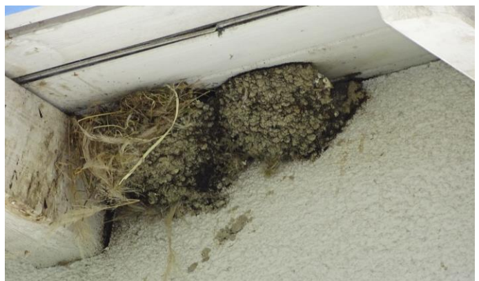
Konkurrenz um Nistplätze zwischen Mehlschwalbe und Hausspatz in Uetikon

Gebäudebrüter stehen in diesem Jahr beim NVMU im Fokus (siehe auch GV Vortrag von Iris Scholl). An der Exkursion zum Thema zeigte Amadeus Morell unter vielem anderen auch eine nicht von Hausbewohnern aber von Hausspatzen bedrängte Kolonie von Mehlschwalben in Uetikon (siehe Foto). Neben Dohlen, Turmfalken, Hausrotschwanz und vielen anderen Arten wurden insbesondere Mauersegler und Schwalben thematisiert.