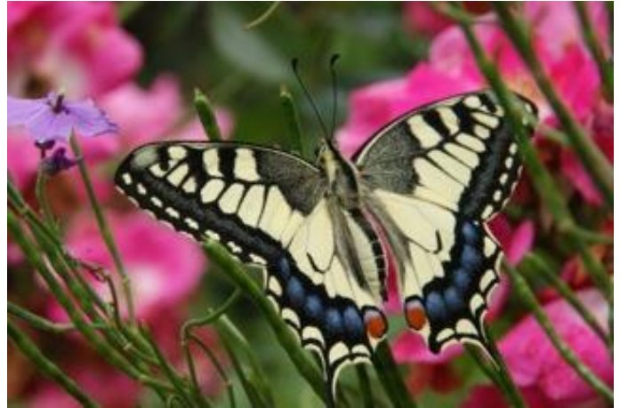
Schwalbenschwanz eine Pracht!