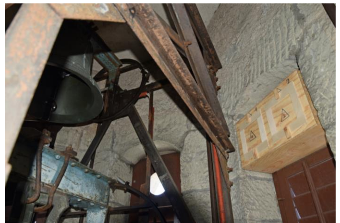
Dohlennistkasten im Kirchturm

Nachdem mehrmals beobachtet wurde, wie Dohlenpaare die beiden Kirchtürme in Männedorf auf ihre Eignung als Brutplätze inspizierten, stellte der NVMU stellvertretend ein «Mietgesuch» an die Kirchengemeinden. Die katholische Behörde erlaubte uns schliesslich, im Turm der St. Stephanskirche drei Nistkästen für sie zu montieren. Bereits Tage später war der erste bereits besetzt! Insgesamt haben drei Paare gebrütet und mehrere Junge hochgezogen. Eine Erfolgsgeschichte!