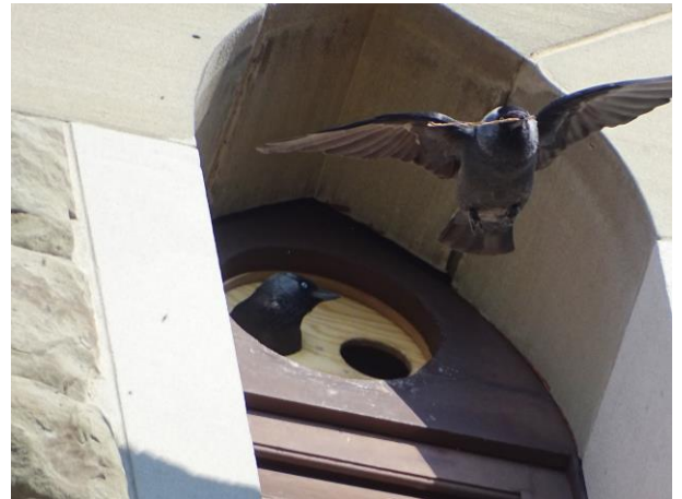
Dohlenpaar im neuen Nistkasten am Turm der katholischen Kirche St. Stephan

Unser Blick ist allerdings weniger zurück als nach vorne gerichtet. Auch in einer mehr verdichteten Agglomerationsstadt gibt es etliche Chancen für mehr Natur. Dafür setzen wir uns ein. Machen Sie mit und unterstützen Sie uns in unserem Anliegen. (A. Morell)