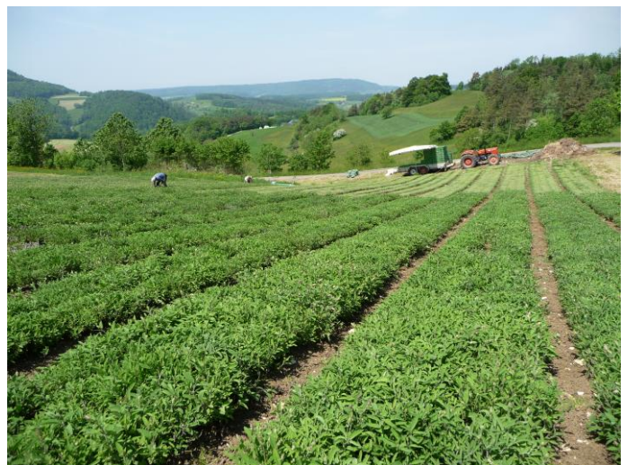
Kräutergärten für Ricola