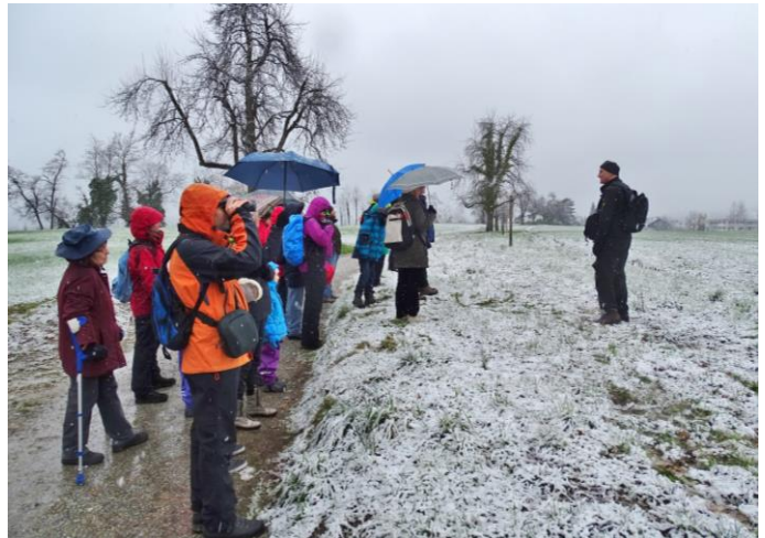
Spechtpirsch bei Schneetreiben