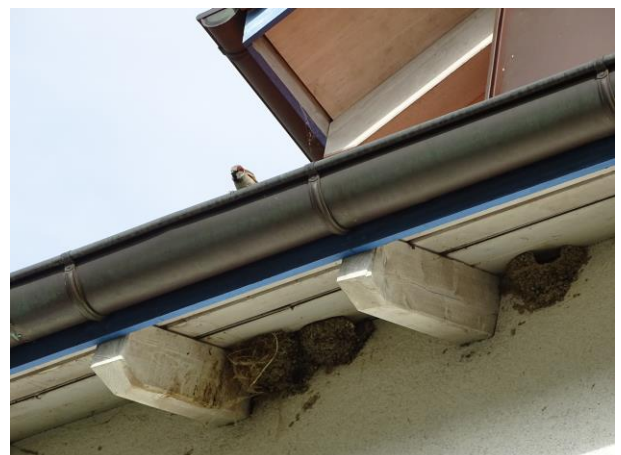
Mehlschwalbennester in Uetikon – die letzten?