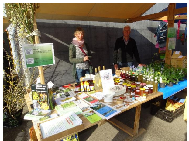
Marktstand mit Infomaterial, Saft und Stauden

An diesem Leuennmärt erweiterte sich temporär die Anzahl der Markt-Teilnehmer und –Anbieter. Dies war eine willkommene Gelegenheit uns wieder einmal einer breiteren Öffentlichkeit mit einer Stauden- und Sträucher-Aktion zu präsentieren. Insgesamt gaben wir an jenem Samstag an interessierte Gartenbesitzer gratis 30 einheimische Sträucher ab, mit der Verpflichtung, über den Pflanzenerfolg ein Erfolgsfoto ans Naturnetz Pfannenstil zu senden. Die Aktion, vom Naturnetz Pfannenstil initiiert, war ein grosser Erfolg, denn 50 Prozent der Beschenkten meldeten die erfolgreiche Anpflanzung mit einem Foto. Ausserdem verkauften wir unzählige einheimische Stauden von der Gärtnerei van Oordt, welche die Gärten von Männedorf nun naturnah bereichern.