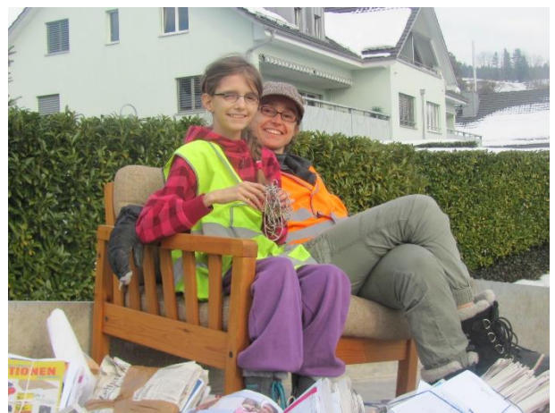
So gemütlich kann die Papiersammlung sein ...

Verschiedene Helfer meinten, es liege nicht allzuviel Papier draussen bereit, vielleicht seien einige Männedörfler am Morgen in die