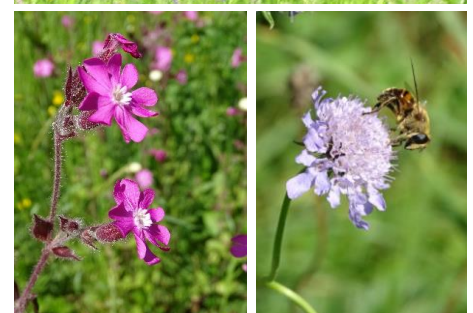
Chiletöbeliwiese mit Bienennisthilfe, Distelfink, Waldnelke, Witwenblume