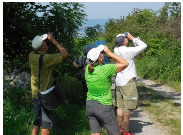
Was ist das für ein Vogel? „Sommergoldhähnchen!“

„Amsel, Drossel, Fink und Star oder wer's auch immer war“. Mit dieser Schlagzeile in der Anzeige in der Zürichsee-Zeitung boten die beiden Natur- und Vogel-Schutzvereine Männedorf/Uetikon/Oetwil und Meilen einen ornithologischen Grundkurs an, mit dem Ziel die häufigsten Vögel der Region besser kennen zu lernen. Dieses Angebot stiess auf grosses Interesse und der Kurs war schon bald ausgebucht. Die Schwerpunktthemen über Vögel am Wasser, im Wald, im Siedlungsraum, im Feuchtgebiet und im Kulturland wurden an sechs Theorieabenden und fünf Exkursionen behandelt.