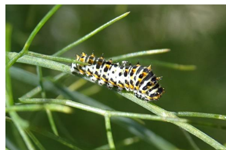
Schwalbenschwanzraupe auf Fenchel

Der traumhafte Tag lud ebenso dazu ein, durch die Gärten der Schule zu schlendern, die bunten Staudenpflanzungen zu bestaunen oder auch nur den wunderschönen Ausblick auf den See, hinüber nach Männedorf zu geniessen. Ein Perspektivenwechsel auf verschiedenen Ebenen. Schon jetzt freuen wir uns auf die diesjährige Exkursion mit der AGN und danken den Organisatoren für den schönen gemeinsamen Tag. (Felix Rusterholz)