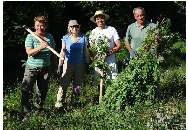
Mit Pickel und Hacke gegen die Robinien

Von Jahr zu Jahr nähern wir uns den Zielen im Bewirtschaftungskonzept der Chiletöbeli-Wiese. Am 14. Juni 2015 fand ein Spaziergang noch im hohen Gras und einer Vielfalt an Blüten und Insekten statt und am 27. Juni 2015 folgte bereits ein Pflegeeinsatz entlang der gemähten Wiese. Holzbeigen und Asthaufen wurden von der armenischen Brombeere - einem hartnäckigen und zähen Neophyten – befreit. Im lichten Wald gegen Osten wurden Sträucher zurückgeschnitten und die breitflächig ausschlagende Robinie bekämpft. Ein Augenschmaus bilden die fünf Kopfweiden am Fusse der Wiese, die im Winter zurückgeschnitten wurden und nun prächtige, goldgelbe Ruten tragen. (Liselotte Hanimann)