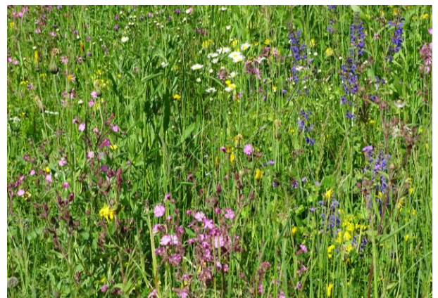
Blumenpracht der Chiletöbeliwiese aus UFA Saatgut

Der „Blumenwiesen-Papst“ wie er auch da und dort genannt wird, führte uns unterhaltsam und spannungsreich durch die Vielfalt von Blumenwiesen. Er zeigte mit viel Herzblut auf, wie aus einer vergandeten Wiese eine schöne Blumenwiese entsteht und wie sich mit einer geschickten Wahl des Saatguts und des Mähregimes die Artenvielfalt auch jahrelang erhalten lässt. Mit seiner sichtlichen Liebe zu allem was blüht und seinem breiten Wissen durch jahrelange Erfahrung war er auch der anschliessenden Fragenflut aus dem Publikum gewappnet. Gemäss seinen Anweisungen haben wir auch die Aufwertung der Chiletöbeliwiese (Bild) durchgeführt. Mit begeistertem Applaus ward ihm gedankt. (Liselotte Hanimann)