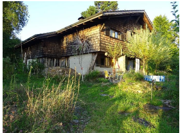
Das Haus Allenwinden mit dem Naturgarten

Der NVMU unterstützt den neu gegründeten Trägerverein, der das Ziel hat, den Naturgarten am Löhnerenweg auszubauen und zu einem regionalen Treffpunkt zur Förderung von Naturgärten zu betreiben.