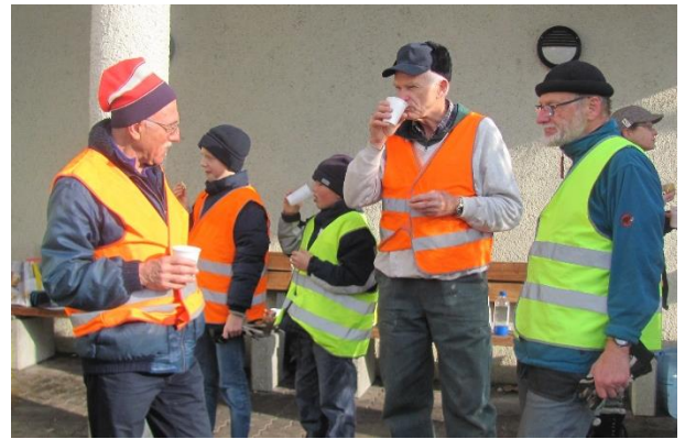
Für die Pausenverpflegung ist stets gut gesorgt