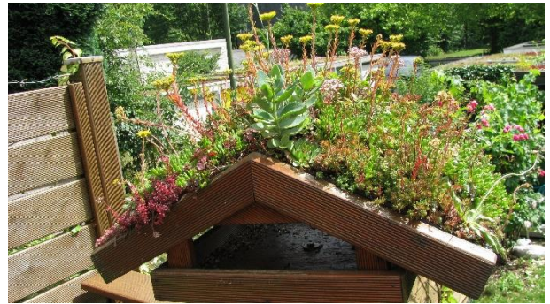
Dachgärten sind eine Bereicherung Foto: Dachbegrünung

Die Bevölkerung von Männedorf wurde dazu aufgerufen, Einwendungen zur Revision der Bau- und Zonenordnung BZO bis spätestens März 2014 einzureichen. Gerne nahm sich der Vorstand diesem politischen Prozess an, um die Werte und Ziele des Vereins langfristig und verbindlich in den Richtlinien der Gemeinde zu verankern. Wertvolle bestehende Lebensräume für Flora und Fauna sollen bei Bauprojekten erhalten sowie nach Möglichkeit auch neue geschaffen werden.