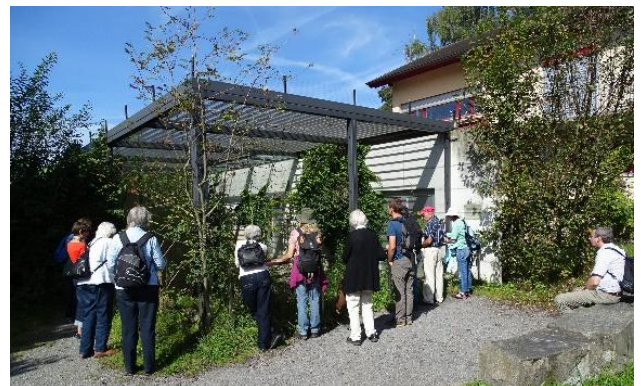
Betrachtung der Voliere