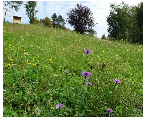
Chiletöbeliwiese in Blüte

„Zri-zri-zri“. Diese liebliche Stimme soll dank den Bemühungen des NVMU schon bald wieder vermehrt aus dem Chiletöbeli ertönen. Bis zu 100 Metern weit ist das Singen der Feldgrillen in offener Landschaft zu hören. Diese Weite wird im Siedlungsraum jedoch immer knapper. Das wird auch der Feldgrille mehr und mehr zum Verhängnis. Grund für Pro Natura, die kleine Heuschreckenart 2014 zum Tier des Jahres zu küren und Ansporn für den NVMU, eine bisher unscheinbare Wiese im Herzen von Männedorf zu neuer Blüte zu verhelfen.