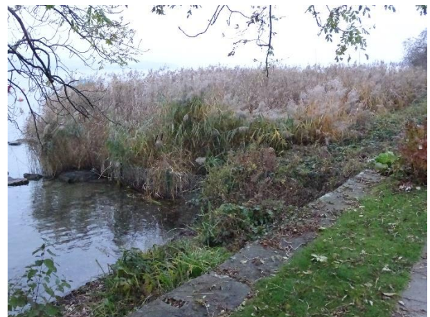
Dieser Schilfbestand dürfte grösser sein

Die Gemeinde Männedorf ist in der glücklichen Lage, über einen zusammenhängenden und öffentlich zugänglichen Seeanstoss von über 400m zu verfügen. Unterhalb des Spitals, zwischen Fischerhüsli und Segelklub liegend, sollte die jetzige Freihaltezone der Erholungszone zugeteilt werden, sodass gewisse Veränderungen in Gestaltung und Nutzung möglich werden. Auch dieses politische Vorhaben wurde durch den Vorstand geprüft und offiziell dazu Stellung genommen. Wiederum standen Flora und Fauna, der allgemein stark strapazierte Ufergürtel, aber auch das öffentliche Nutzungsinteresse im Zentrum der Betrachtung.