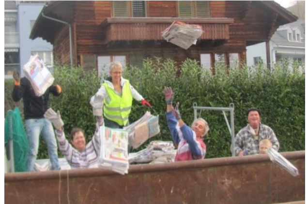
Mit Schwung und Spass dabei

Schon anfangs Woche sah die Liste der angemeldeten Helfer und Helferinnen vielversprechend aus, am letzten Tag vor der Sammlung waren dann sogar so viele angemeldet, dass nicht für alle ein Sitzplatz in den sechs Fahrzeugen vorhanden war. Mit dieser Rekord-Teilnehmerzahl von 24 Personen (davon 5 Kinder) wurde bei angenehmer Temperatur und trockener Witterung die Arbeit angepackt. Wer nicht unterwegs war zum Sammeln, half allen Mannschaften beim Abladen ihrer Ladung und beim Bereitstellen des Znünis.