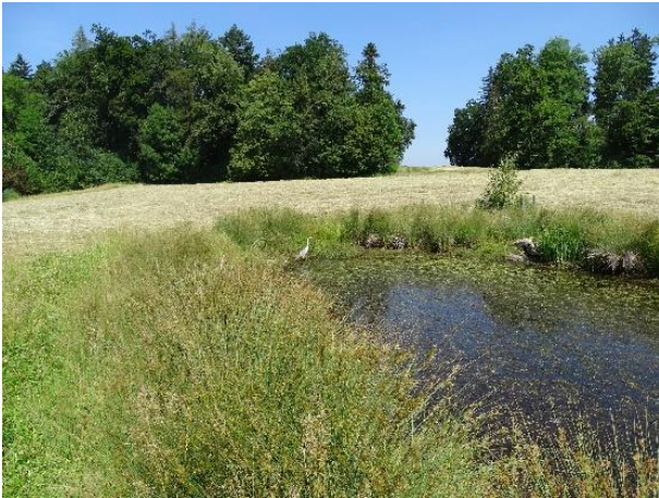
Weiher bei Oetwil