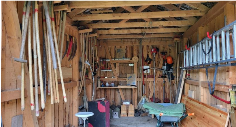
Werkzeugdepot im Steinbrüchel-Schopf