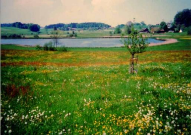
Idyllische Landschaft am Lützelsee