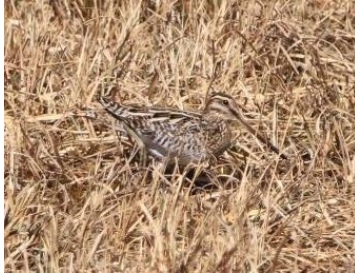
Bekassine gut getarnt