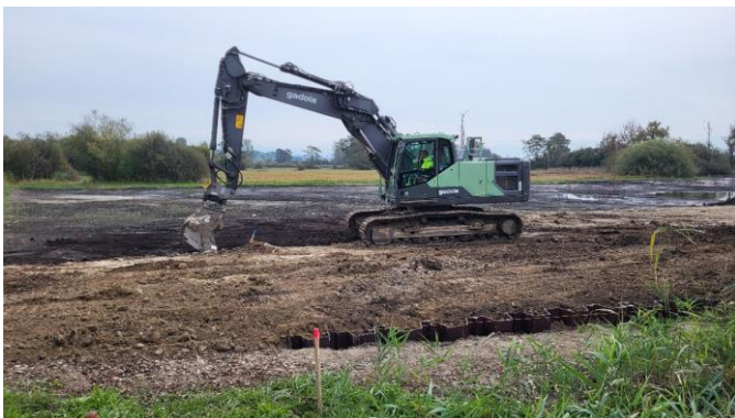
Hier wird ein Flachmoorteil renaturiert

Während der Exkursion zeigten sich sowohl standorttreue Vögel als auch Zugvögel, die im Ried Rast einlegen, um ihre Energiereserven für den langen Weiterflug aufzufüllen. Besonders erfreuten uns fliegende Kiebitze, eine Bekassine und eine Klappergrasmücke. Das besondere Highlight war ein Eisvogel, der von seiner Sitzwarte nach Beute Ausschau hielt – und stosstauchend erfolgreich war: