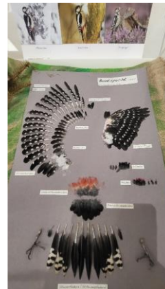
Gefiederbild des Buntspechts