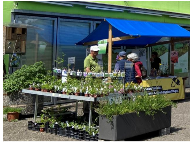
Naturstaudenstand mit NVMU-Beratung 2024

Das Angebot von regional-spezifischer Sorten von Wildstauden und Saatgut wird in einer breiten Artenpalette neu aufgebaut. Dieser Bestandteil des umfassenden Masterplans ist für den Naturschutz im ganzen Kanton Zürich von wegweisender Bedeutung und verdient volle Unterstützung.