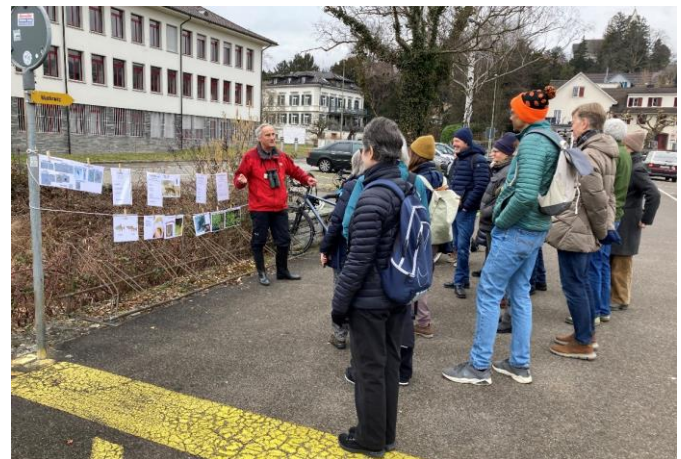
Wie verändert die Quagga-Muschel die Seeökologie?