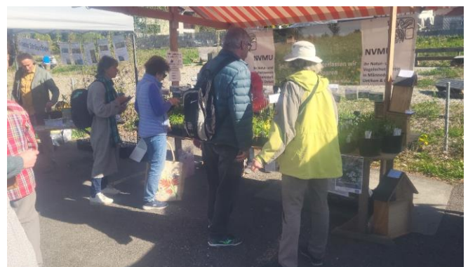
Wildstauden vom Appisberg u.v.m.