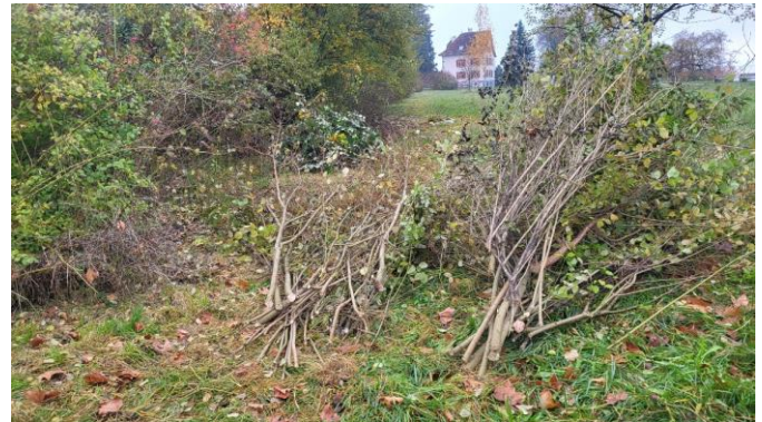
Der Hartriegel musste etwas eingedämmt werden

Im Oktober schneiden wir jeweils die weit-rankenden Armenischen Brombeeren zurück. Im Februar werden stark wachsende Bäume und Sträucher auf den Stock gesetzt. Zwischendurch müssen die beiden Sandlinsen sanft gejätet sowie ein schmaler Streifen rundherum gemäht werden, bevor der Landwirt die Wiese maschinell pflegt.