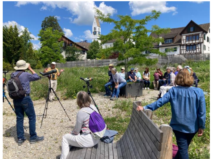
Abschluss einer Grundkurs-Exkursion auf der bunten Ruderalfläche auf Mittelwies in Männedorf mit einer grossen Vielfalt an Pflanzenarten.

Packen wir es gemeinsam an, es gibt einiges zu tun.