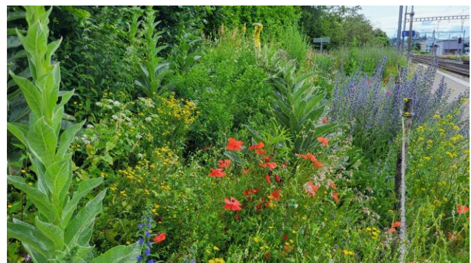
Eine Fülle herrlicher Stauden erfreut unser Auge und ist Lebensraum für viele Insekten u.a. Tiere.

Hier muss man in kürzeren Abständen jäten, denn die prächtige Ruderalfläche benötigt öfters einen Einsatz, um die aufkommenden Neophyten sowie unerwünschte schnell wachsende Beikräuter zu bekämpfen. Die Wiesen und den Hang mähen wir selber.