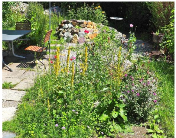
Ein Garten für Mensch und Natur