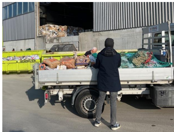
Papier abladen bei Schneider-Recycling

Dieses Jahr gab es zwei Besonderheiten: Das Papier musste an der Sammelstelle beim Schneider Umweltservice von Hand abgeladen werden.