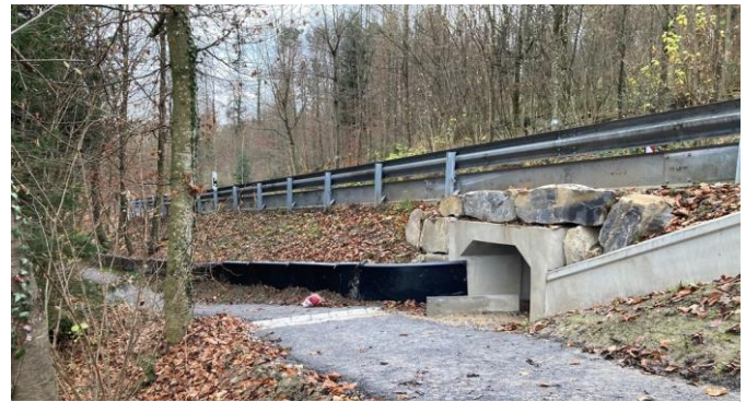
Neue Amphibienunterführung Kreuzlenstrasse

Die jährliche Amphibienwanderung begann schon um den 10. Februar. Erdkröten, Grasfrösche und Bergmolche wandern zu ihrem lokalen Laichgewässer, dem Schützenweiher. Damit sie nicht zu Tausenden überfahren werden, wurden die Tiere seit vielen Jahren durch einen mobilen