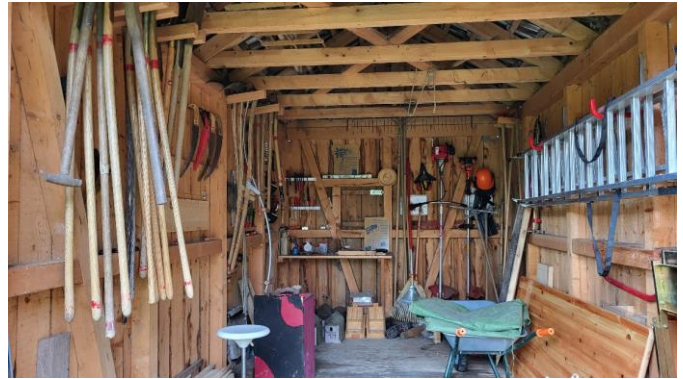
Unsere Hütte im Steinbrüchel mit allerlei Werkzeug

Während des Jahres müssen jeweils die aus der Hecke in die Strasse wachsenden oder herunterhängenden Äste zurückgeschnitten werden. Zudem sind die drei Sandlinsen zu jäten und die Obstbäume zu pflegen bzw. Jungbäume zu 'erziehen'.