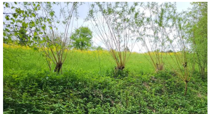
Noch junge Kopfweiden am Rand der Wiese

Wir machen hier v.a. Feinarbeiten, d.h. wir pflegen die Hecken und Kopfweiden, unterhalten die Kleinstrukturen und achten, dass sich Neophyten nicht ausbreiten können. Die invasiven Robinien wurden von der Gärtnerei Eugen Bühlmann geringelt. Diese Methode wählt man, damit die Bäume nicht eine Unzahl von Wurzeläusläufern bilden, wie sie es tun, wenn man sie einfach fällt.