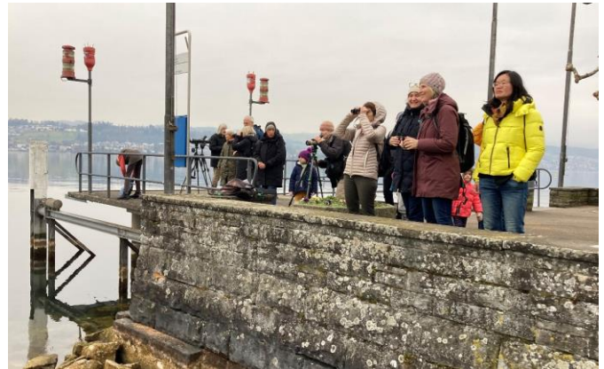
Kolbenenten, Kormoran, Sturmmöwen und mehr...