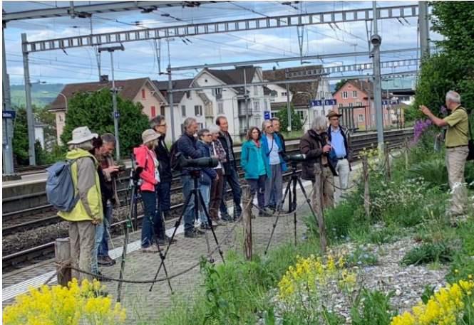
Amadeus auf der neuen Ruderalfläche am Perron 1

Zuest wurde die neueste NVMU-Aufwertung am Perron 1 des Uetiker Bahnhofs, am Männedorfer Ende gezeigt. Es hat sich eine reich blühende Ruderalvegetation mit Königskerzen, Wegwarten, Mariendistel und weiteren ca. 50 Arten von Blütenpflanzen entwickelt, wo früher nur Brombeeren und Goldruten wucherten.