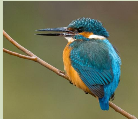
Eisvogel 'Vogel des Jahres'