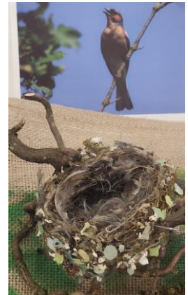
Buchfink hat sein Nest mit Konfetti dekoriert