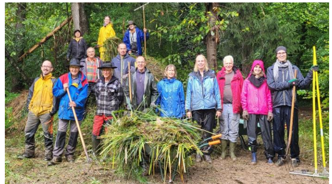
Gruppenbild der tüchtigen Pfliegergruppe Sept. 2025

Zwischendurch müssen auch Neophyten v.a. das Drüsige Springkraut bekämpft werden.