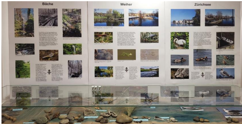
Poster und Vitrine mit Präparaten zu den Gewässerlebensräumen